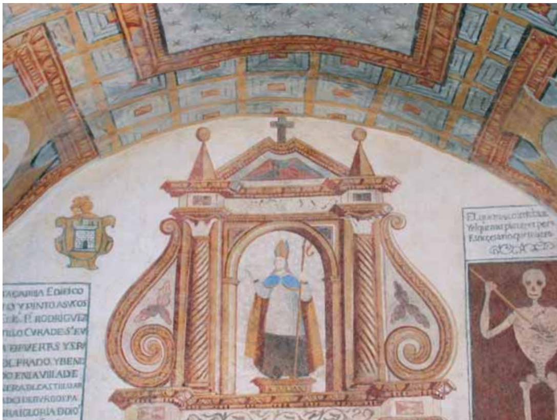
▲ Estado final de las pinturas de la cabecera tras la intervención.