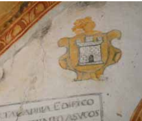
▲ Eliminación del repintado de fondo ocre y recuperación de los bordes ocultos por los temple y capas de cal.