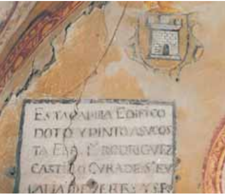
Detalle del proceso de la limpieza química.

Texto elaborado a partir de la memoria final de la actuación realizada por Jesús Puras Higuera.