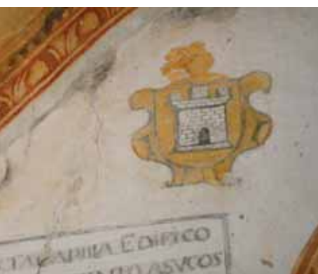
▲ Eliminación del repintado de fondo ocre y recuperación de los bordes ocultos por los temple y capas de cal.