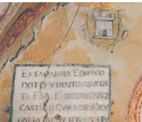
Detalle del proceso de la limpieza ▼ química.

Texto elaborado a partir de la memoria final de la actuación realizada por Jesús Puras Higuera.